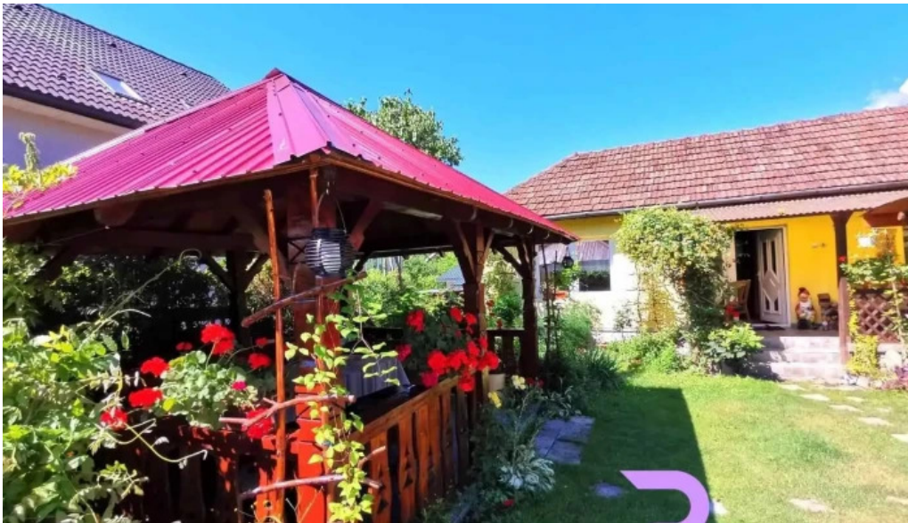
Casa otília exterior