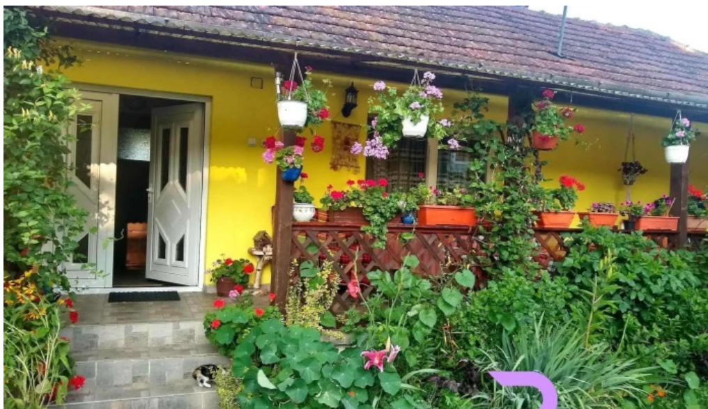
Casa otilia cabana