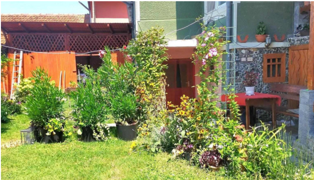
Casa otília de la vizitatori