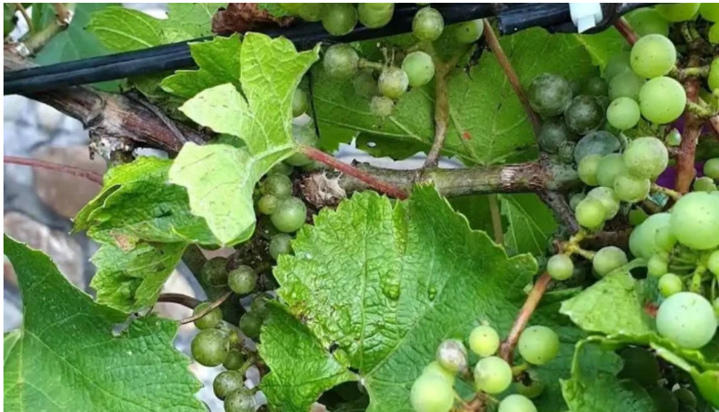
Casa otília mancaruribauturi