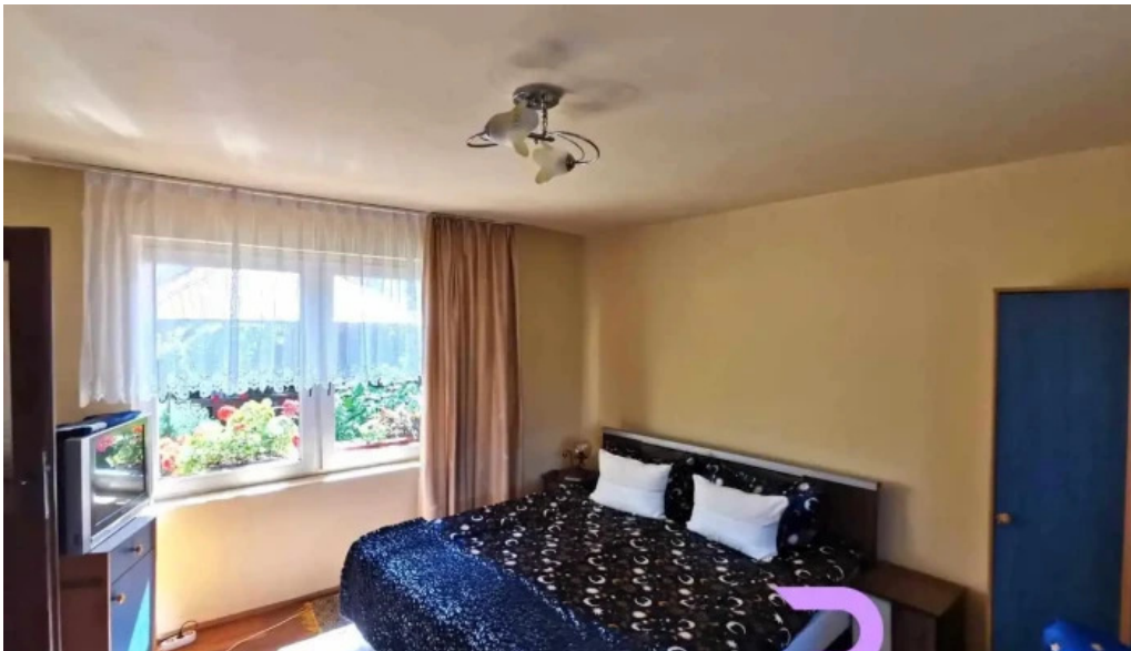
Casa otília camere