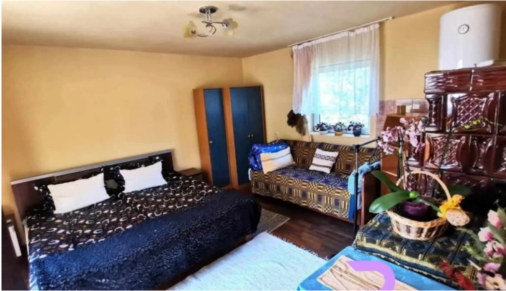
Casa otília de la proprietar