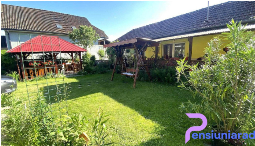
Casa otília num?r