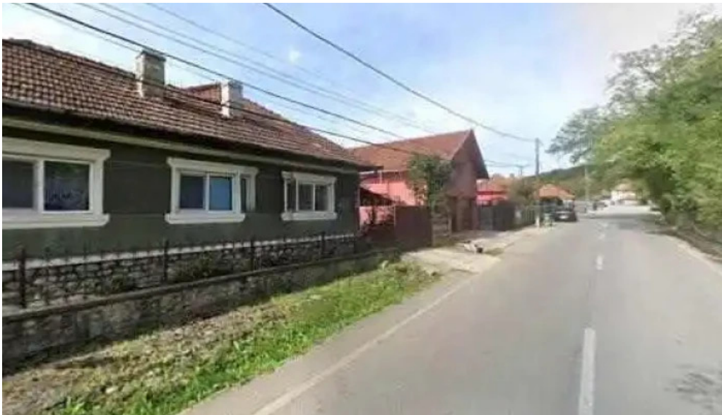
Casa otilia street view si 360deg