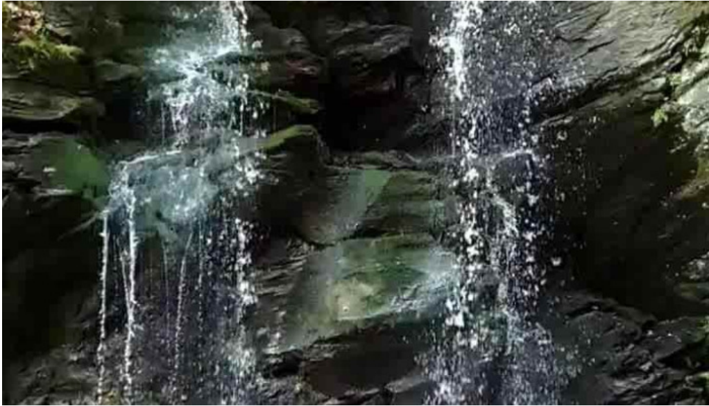
Casa otilia videoclipuri