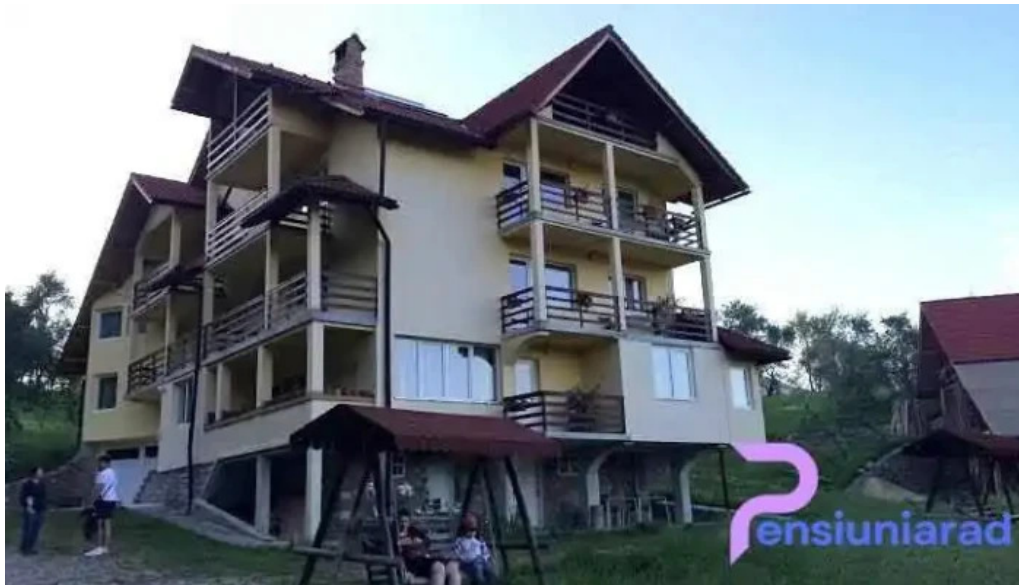
Pensiunea tiu?a corbeni