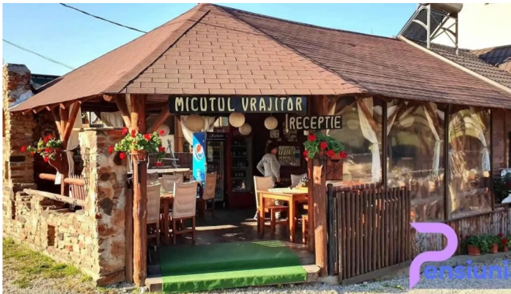
Micutul vrajitor de la vizitatori