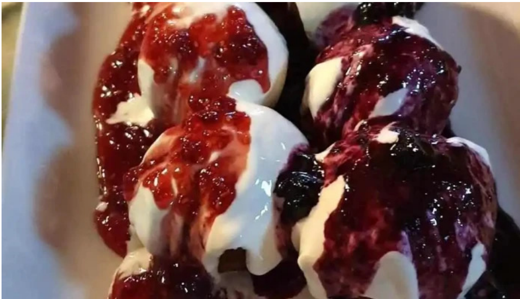
Micutul vrajitor mancaruribauturi