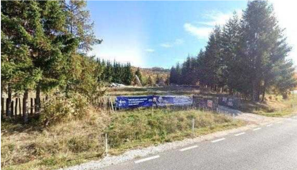
Micutul vrajitor street view si 360deg