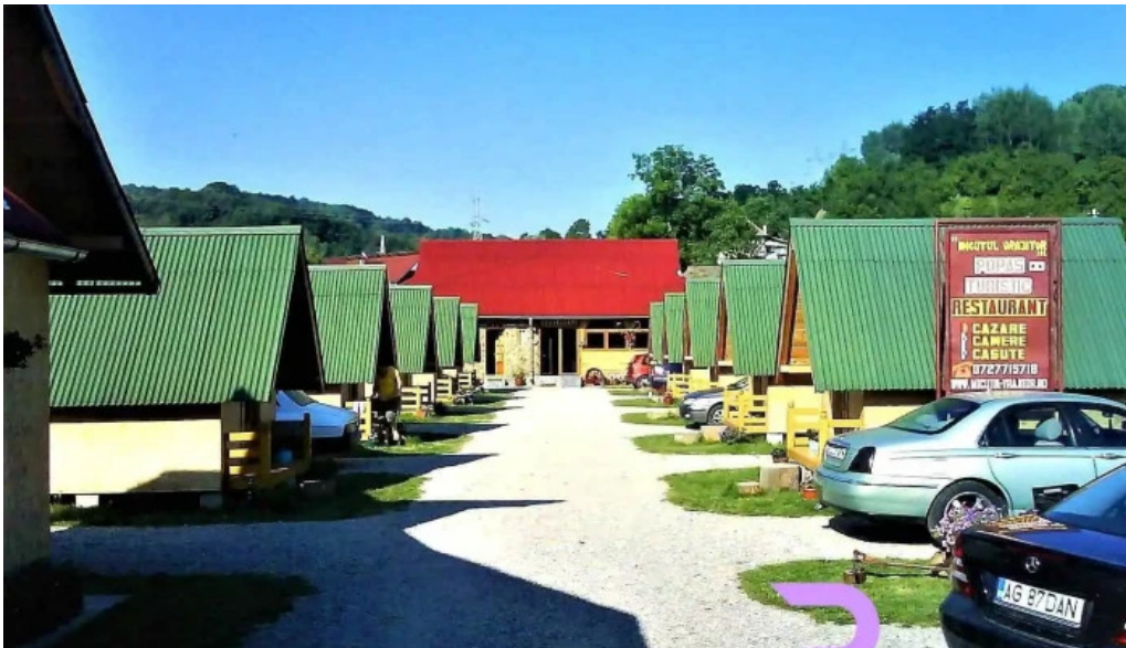
Micutul vrajitor promo?ie