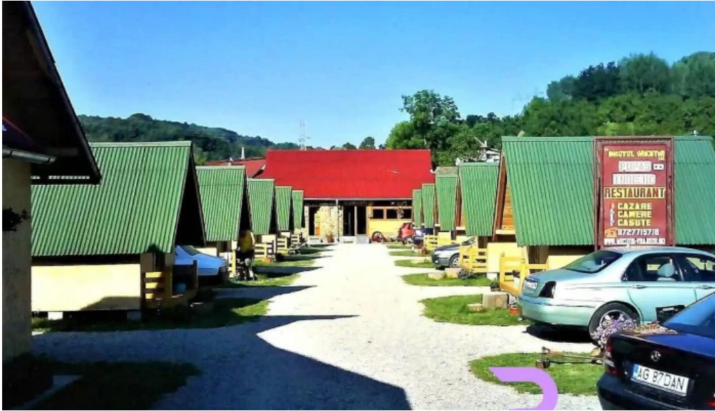
Micu?ul vr?jitor arefu