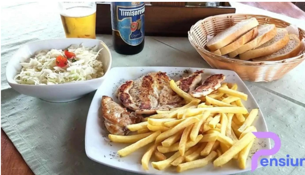
Micutul vrajitor mancare