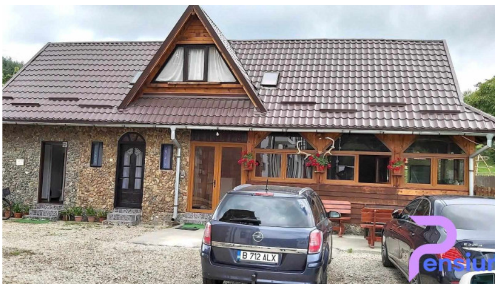
Micutul vrajitor cabana