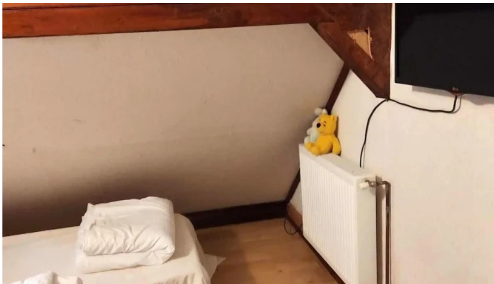
Micutul vrajitor camere