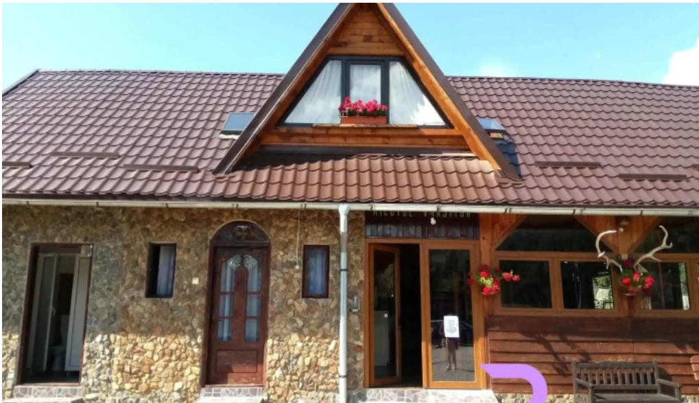
Micutul vrajitor exterior