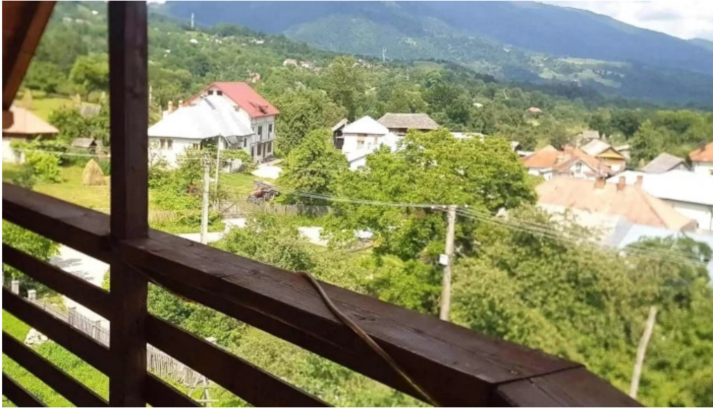
Chemarea muntilor pre?uri