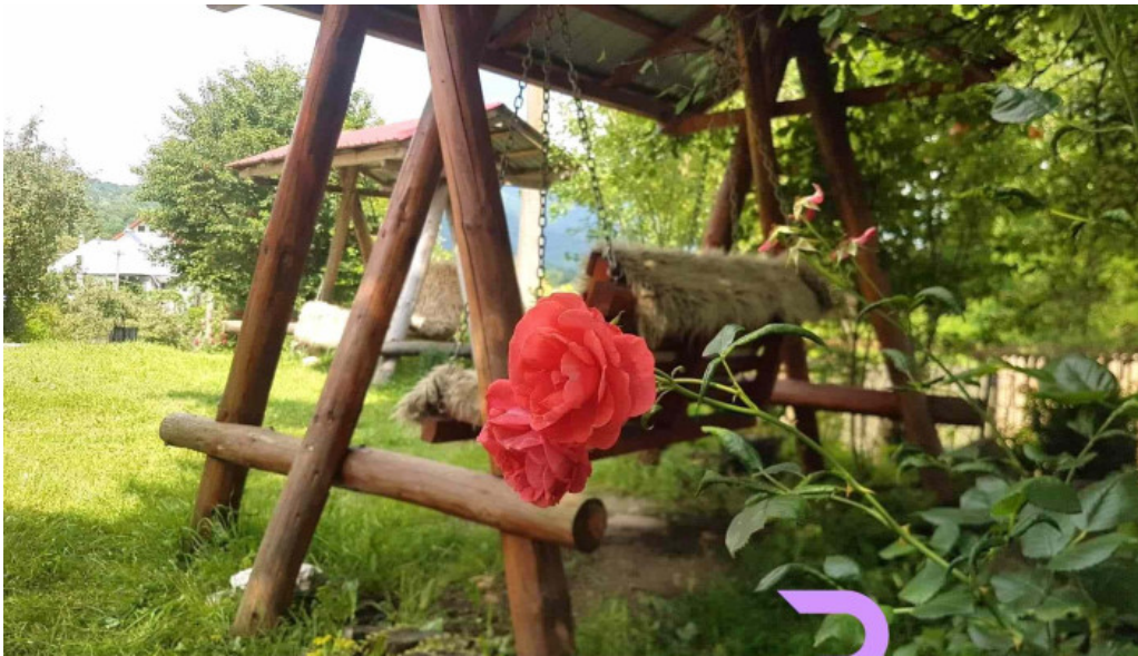
Chemarea muntilor de la vizitatori