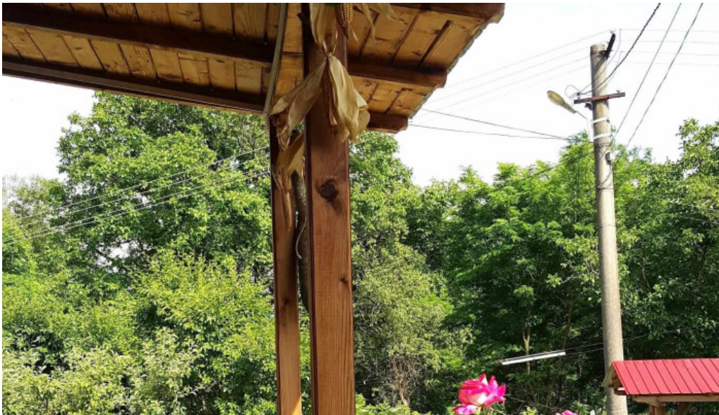
Chemarea muntilor program