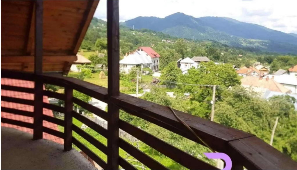
Chemarea muntilor exterior