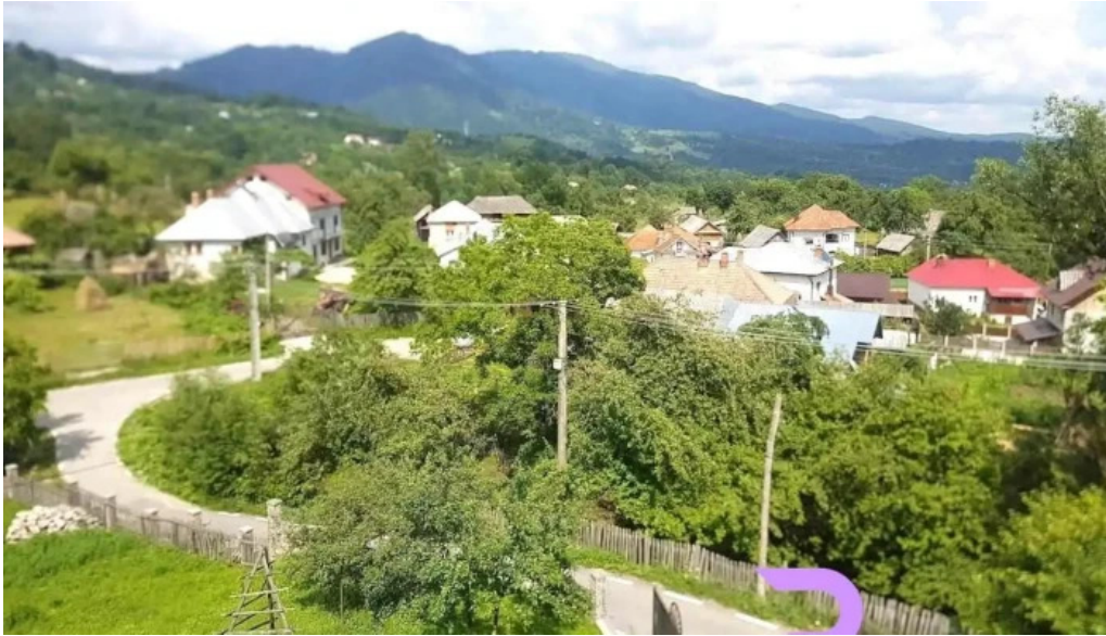
Chemarea mun?ilor arefu