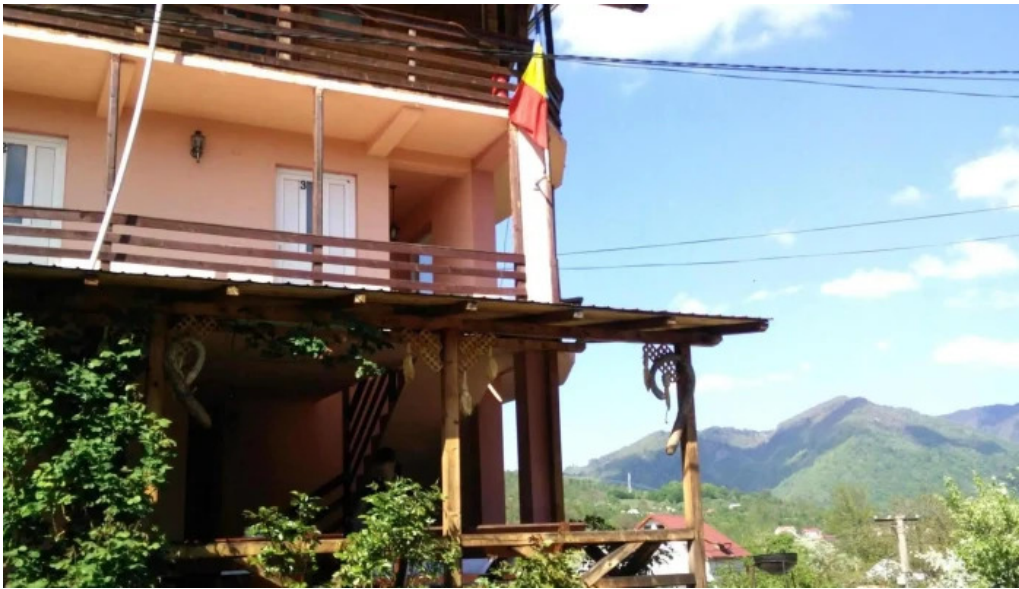
Chemarea muntilor scor