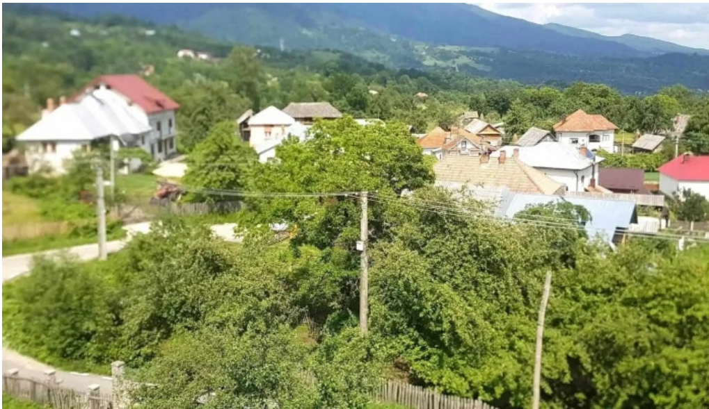
Chemarea muntilor arefu