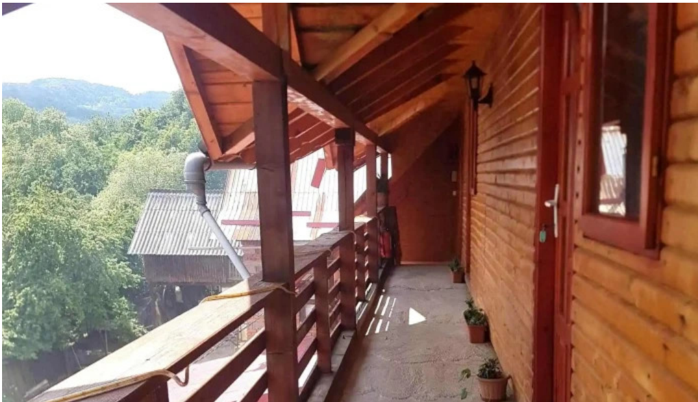
Chemarea muntilor zon?