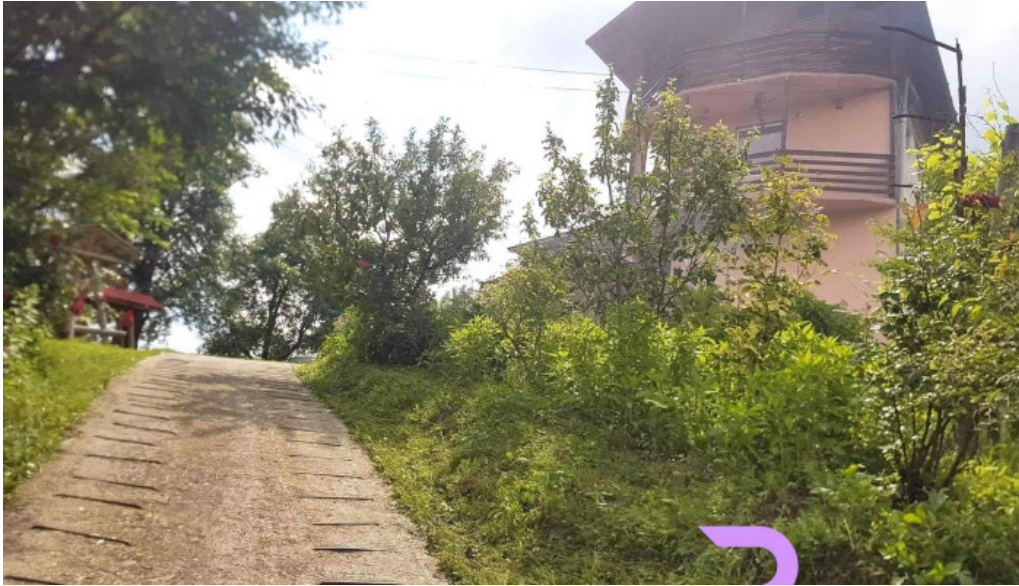
Chemarea muntilor cabana