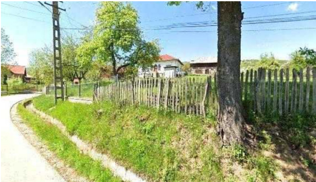
Chemarea muntilor street view si 360deg