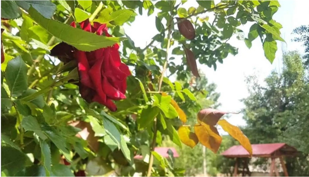
Chemarea muntilor unde